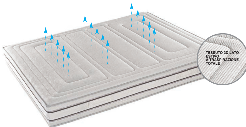
TESSUTO 3D LATO ESTIVO A TRASPIRAZIONE TOTALE

Il composto è altamente tecnologico ed innovativo. Ergonomico in quanto si modella perfettamente ad ogni parte del corpo assecondando un sostegno perfetto ed equilibrato. Termosensibile perchè la temperatura corporea agisce sulla struttura molecolare di questo materiale rendendolo morbido e flessuoso. A lenta memoria poichè è in grado di recuperare lentamente la forma originaria. Ha inoltre spiccate qualità anallergiche,antiacaro e antibatteriche .