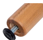
Piede centrale regolabile.